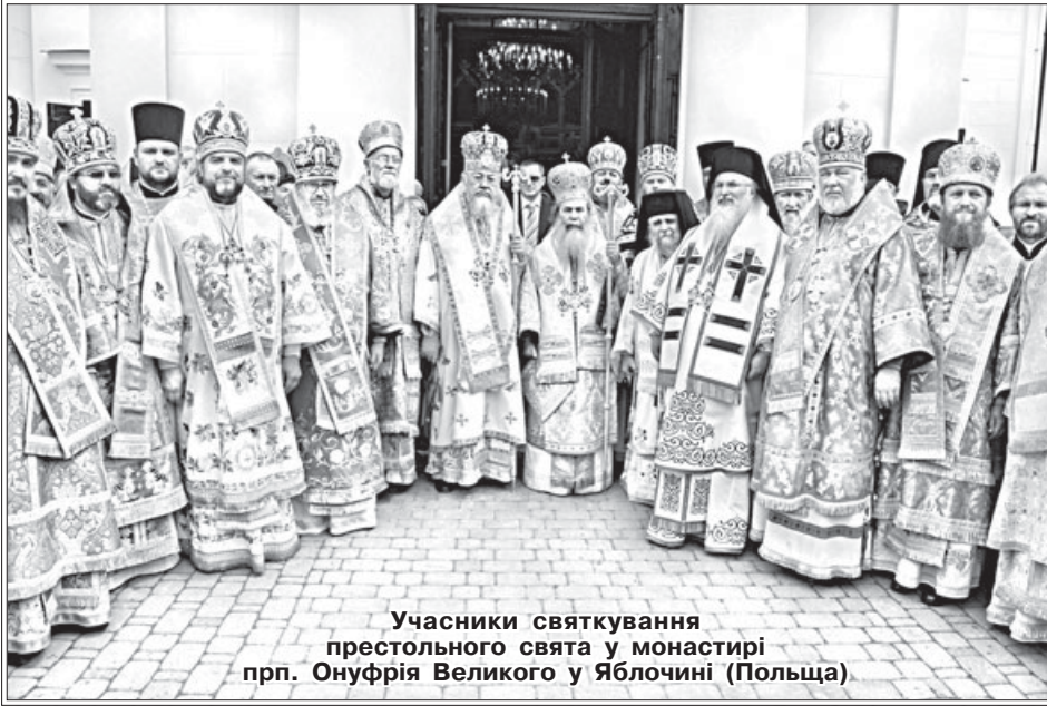
Учасники святкування престольного свята у монастирі прп. Онуфрія Великого у Яблочині (Польща)

9 липня , у день святкування 87-ї річниці Калинівського чуда, відбувся хресний хід від центрального храму м. Калинівки до каплиці, встановленої на місці хреста, пробитого кулями червоноармійців у 1923 році. Із хреста тоді потекла кров, що стало причиною особливого його шанування віруючими і ненависті з боку безбожної влади. По завершенні хресного ходу духовенством Калинівського благочиння на чолі з протоієреєм Володимиром Розманом були відслужені святкова Літургія, водосвятний молебень, а також заупокійна літія про постраждалих від безбожників за шанування калинівського хреста.