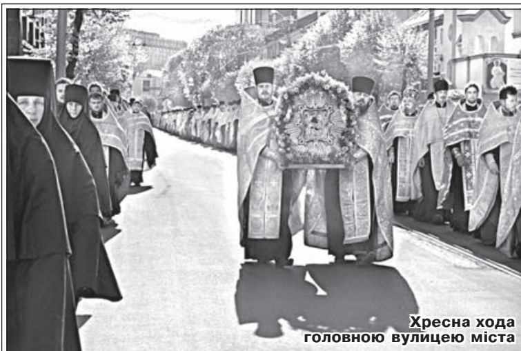
Хресна хода головною вулицею міста