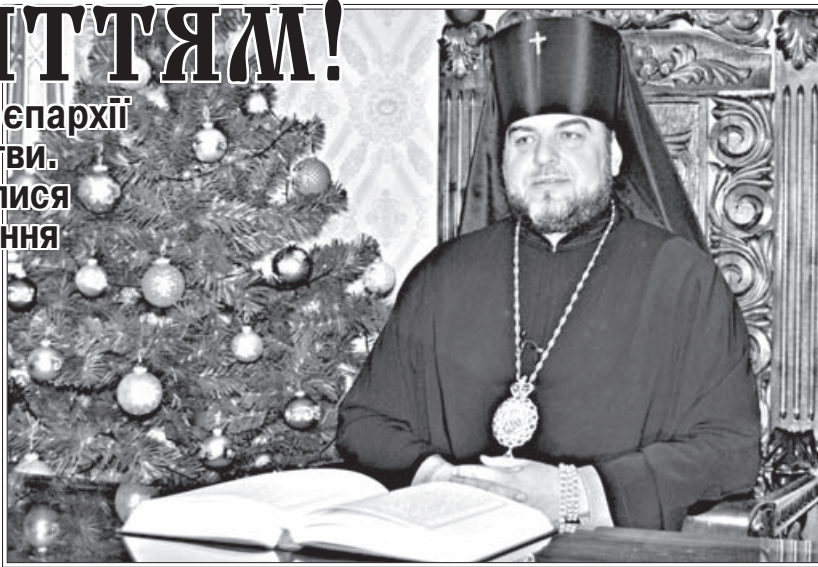
У новорічну ніч в ефірі Вінницького державного телебачення та ТРК «Вінниччина» владика привітав подолян з Новим роком

Архієпископ Симеон нагадав віруючим слова святителя Феофана