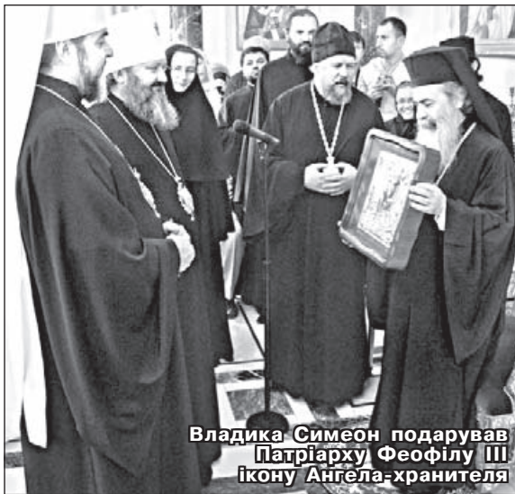
Владика Симеон подарував Патріарху Феофілу III ікону Ангела-хранителя

З 27 жовтня по 5 листопада митрополит Вінницький і Могилів-Подільський Симеон перебував на Святій Землі.