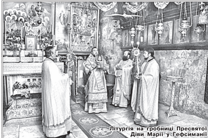
Літургія на гробниці Пресвятої Діви Марії у Гефсиманії

28 жовтня вінничани відвідали Йордан: омилися у священних водах річки, в якій відбулося Хрещення Господне, побували на