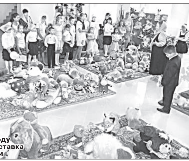
У рамках заходу проходила виставка м'якої іграшки

ма фестивалю охоплювала цілий місяць (із 30 серпня по 2 жовтня) і включала різні події: традиційний дитячий хресний хід з іконою «Всецариця», що знаходиться у Богоявленському храмі м. Вінниці, конкурсні та концертні програми, перегляд художніх фільмів морального змісту, фотоконкурс, зустрічі священників, педагогів та гостей з батьками і дітьми, традиційну поїздку до святинь Поділля, майстер-класи для педагогів, благодійні виставку-ярмарок і поїздку до будинку-інтернату для дітей-інвалідів.