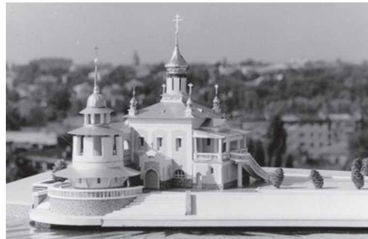
Макет реконструкции храма блаж. Ксении Петербургской

В нашем городе недавно открылся храм святой блаженной Ксении Петербургской.